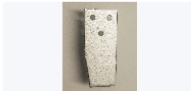
FÖRSTÄRKNINGSVINKEL TILL TS FIXTURER