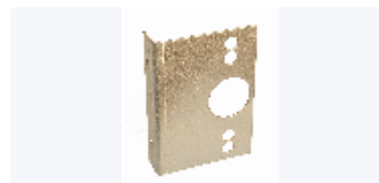
Fäste LK & Uponor väggbockfixtur