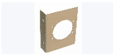
Fäste LK väggdosa UNI Push (Grå)