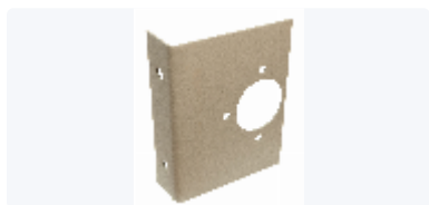
Fäste Vatette V6