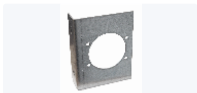
Fäste Sanipex väggdosa