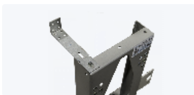
FÖRSTÄRKNINGSVINKEL TILL WC FIXTURER