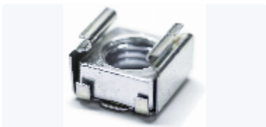
Korgmutter till tvättställsfixtur