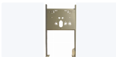
Tvättställsfixtur Universal Justerbar